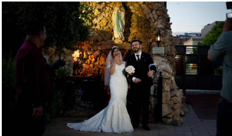
Mariage chaldéen à Erbil, Irak (2016)