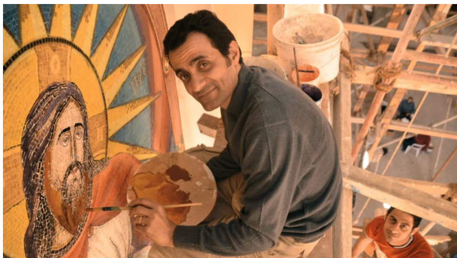
Artiste à l'œuvre sur les murs de la future cathédrale Saint-Paul de Thèbes, Égypte (2014)

En 2020, suite à son déplacement au Moyen-Orient, Emmanuel Macron, président de la République, a annoncé la création du Fonds d'aide aux écoles francophones chrétiennes du Moyen-Orient , qui a permis de financer 129 écoles rien qu'au Liban en 2021.