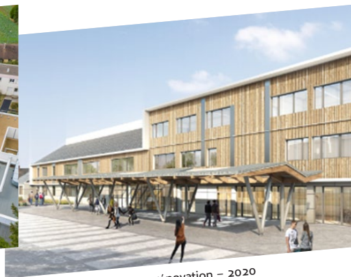
Collège de Bracieux en rénovation – 2020

Le département s'engage pour garantir les meilleures conditions d'apprentissage aux collégiens de Loir-et-Cher.