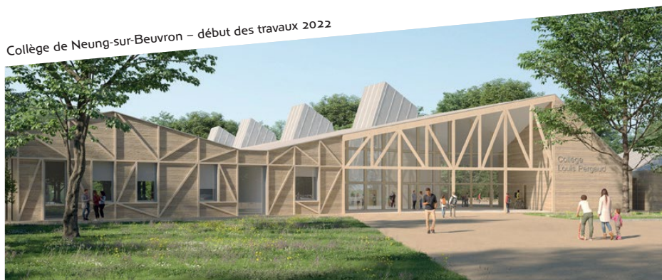
Collège de Neung-sur-Beuvron – début des travaux 2022