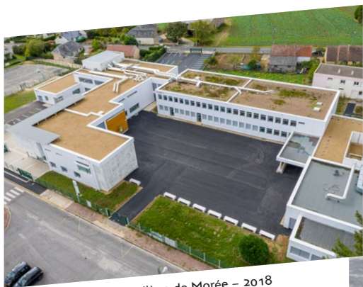
Réhabilitation du collège de Morée – 2018